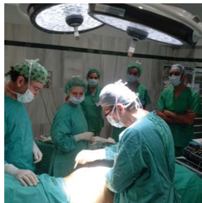
Aspecto del quirófano en plena demostración.