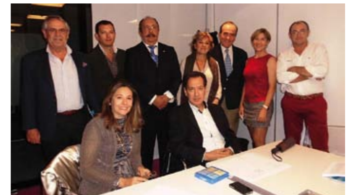
Última reunión de la Junta Directiva saliente.