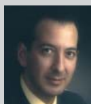
PRESIDENTE Pedro Arquero Salinero