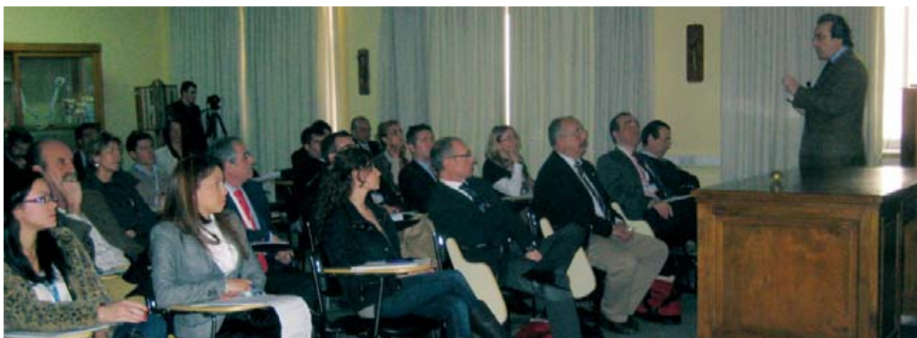
Aspecto de la sala de conferencias