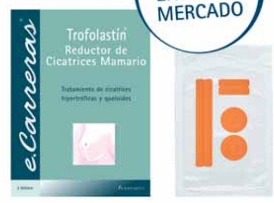
3 blísters de 2 apósitos C.N.: 198445.6